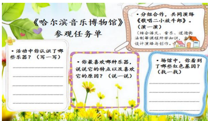
图2 研学手册之《哈尔滨音乐博物馆》参观任务单

学生实地探究哈尔滨音乐博物馆，在教师引导下读音乐史、识音乐家、观器乐展、学红色歌曲，整合历史、音乐、思政等多学科知识，全面感受哈尔滨音乐特色与东北抗联红色文化，再现红色精神传承脉络。