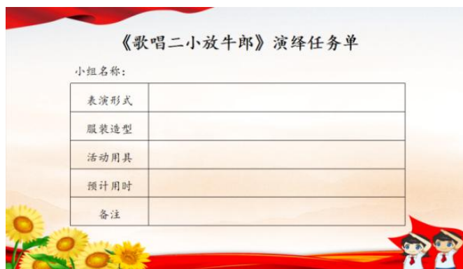
图3 研学手册之《歌唱二小放牛郎》演绎任务单

各小组明确分工、合作排练，完成艺术创编与舞台展示，在实践中提升规则意识、合作能力与艺术表现力。