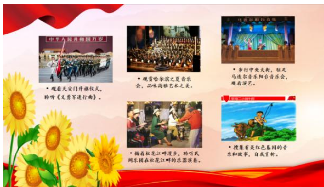
图1 研学手册之《哈尔滨音乐博物馆》行前知识准备单

教师发布线上红色音乐、地方场馆资源包，布置行前准备任务，明确研学目标与要求。学生通过观看中央大街马迭尔阳台音乐会视频、聆听松花江畔民间乐团的演奏、搜集有关红色基因的音乐和故事，了解哈尔滨音乐文化特点，初步感知红色经典内涵，实现课内外有效衔接。