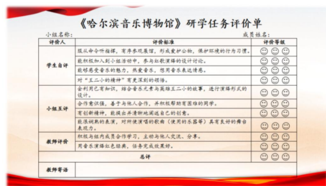
图4 研学手册之《哈尔滨音乐博物馆》研学任务评价单

构建自评、互评、师评三维评价体系，围绕秩序规范、参与度、音乐感知、红色精神领悟、创意设计、合作能力、舞台表现等维度开展过程性评价，全面反映研学育人效果。